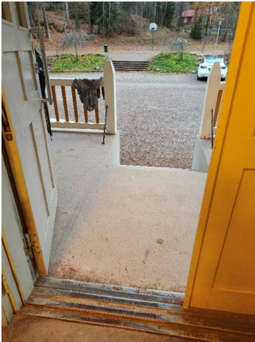
Haukkamäen koulun terveydenhoitajalle pääsy on esteellinen. (Kuva alla.)