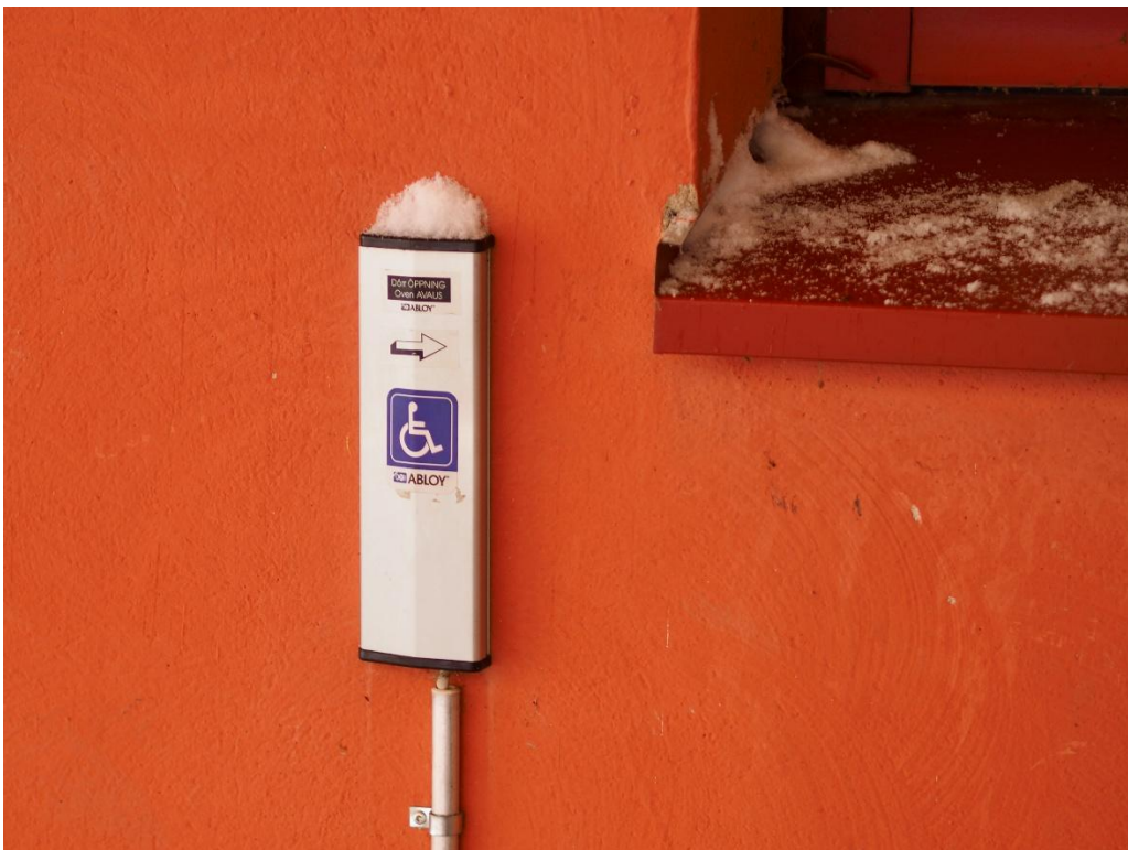
Kuva 4. Oven avauspainike ulkona