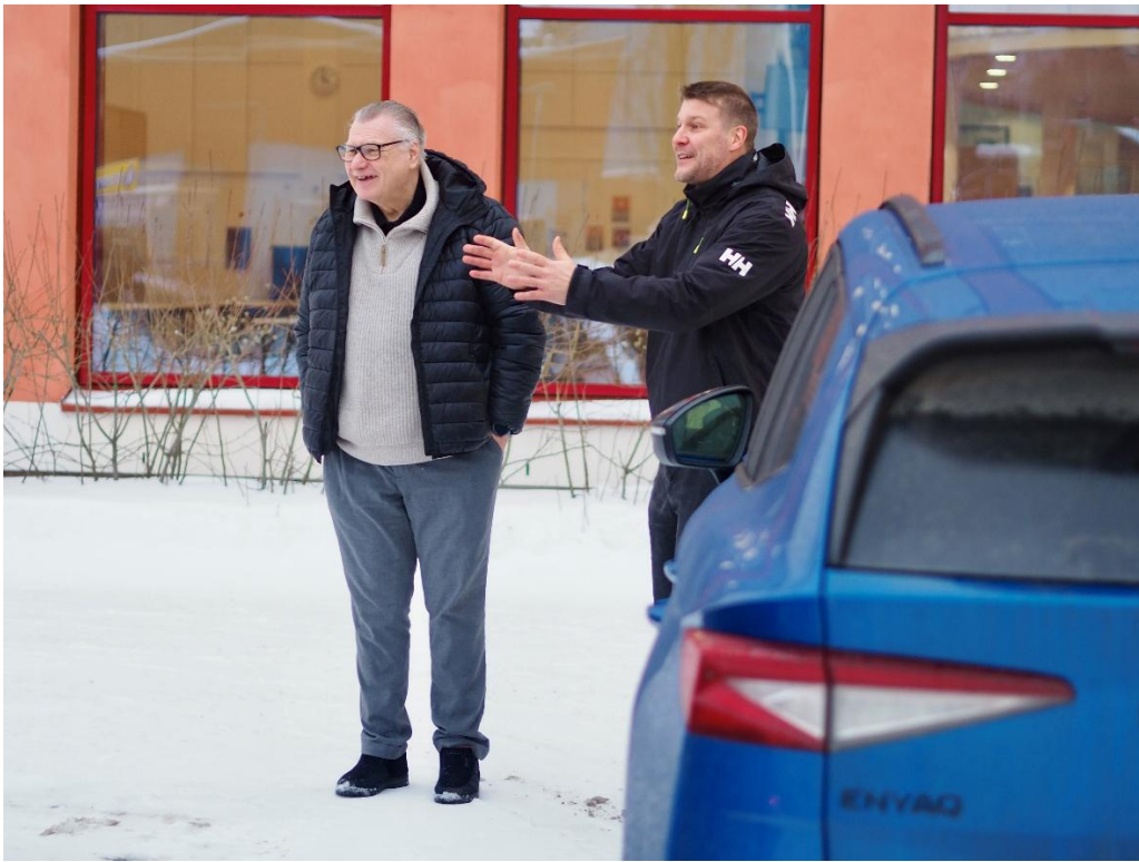
Kuva 3. Nyhkälän koulun pihalla