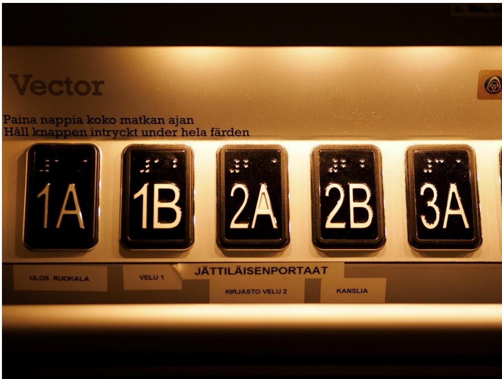
Kuva 7. Hissin painikkeita