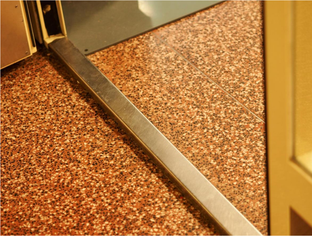
Kuva 5. Kynnys