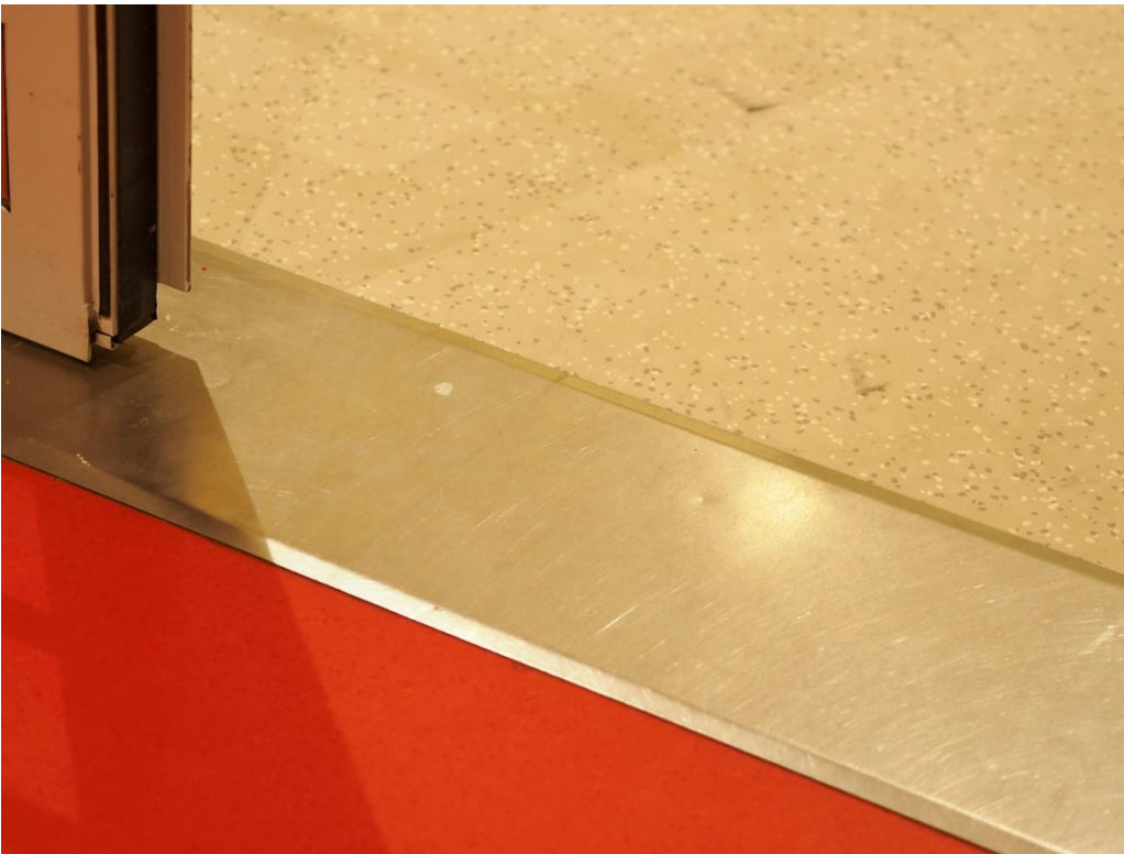
Kuva 6. Parempi kynnys