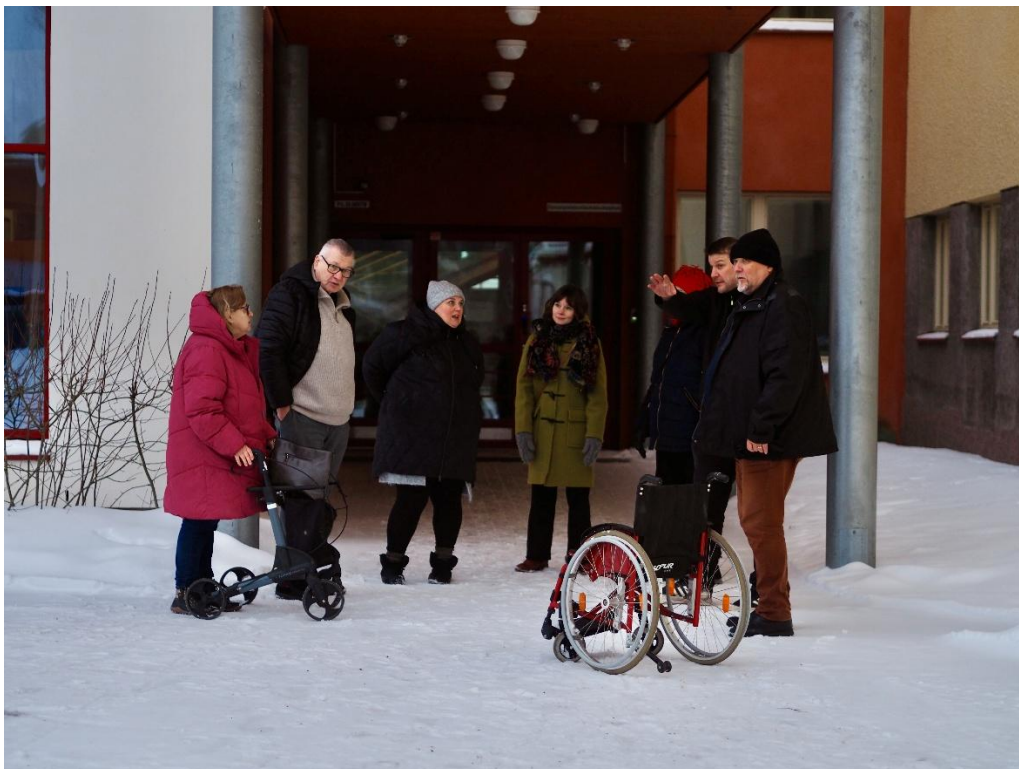
Kuva 1. Esteettömyyskävelylle lähdössä